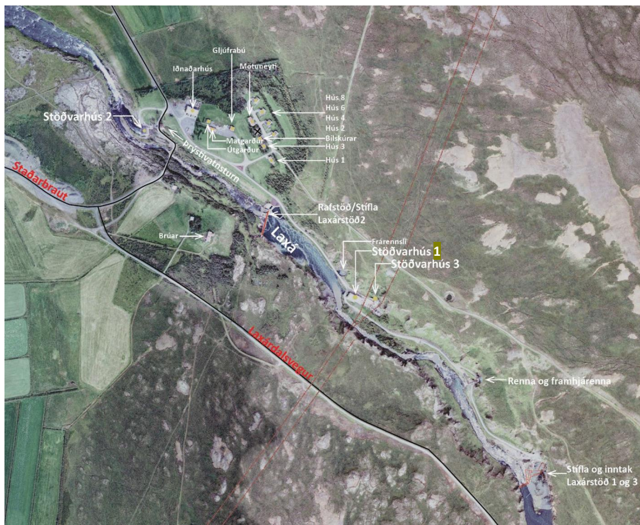
Mynd 1. Laxárstöðvar og helstu kennileiti.

Laxárstöð III er yngsta aflstöðin í Laxá og er uppsett afl hennar 13,5 MW. Hvelping sem hýsir vélasamstæðu stöðvarinnar var upphaflega hönnuð fyrir tvær 25 MW vatnsvélar. Var þá miðað við 56 m háa stíflu ofar í gljúfrinu og að heildarfallhæðin yrði 83 m. Þessari áætlun var harðlega mótmælt af Þingeyingum og lyktir urðu að Laxárstöð III var vígð árið 1973 með einum hverfli í stað tveggja og frekari áform á svæðinu lögð til hliðar.