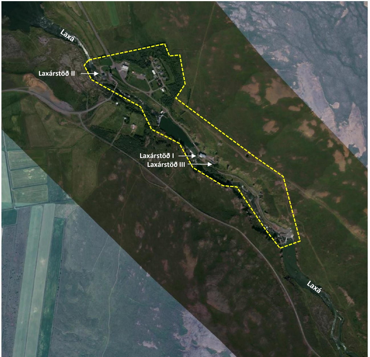
Mynd 2. Áætluð deiliskipulagsmörk Laxárstöðva I, II og III.

Aðkomuvegur inn á svæðið er Staðarbraut (854) en vegurinn liggur í gegnum skipulagssvæðið norðanvert og fer á brú yfir Laxá. Frá Staðarbraut liggja vegir að mannvirkjun Laxárstöðva.