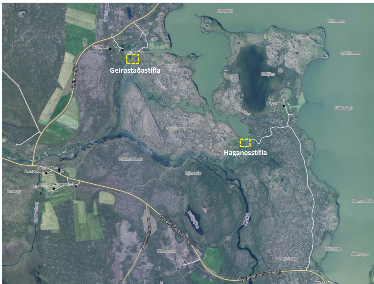
Mynd 3. Áætluð deiliskipulagsmörk Geirastaðastíflu og Haganestíflu.

Innan deiliskipulagsins er einnig svæði við sunnanvert Mývatn en þar eru Geirastaðastífla og Haganestífla sem stýra rennsli úr Mývatni niður Laxá ásamt tengdum mannvirkjum.