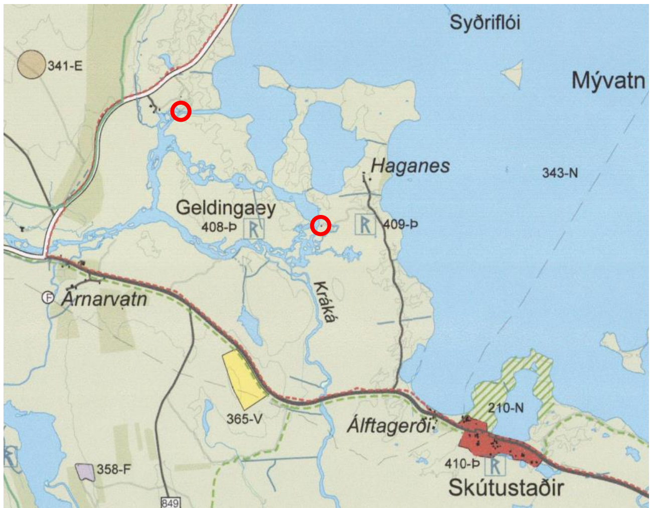
Mynd 5. Hluti Aðalskipulags Skútustaðahrepps 2011-2023 (þéttbýlisuppráttur). Rauðir hringir sýnir staðsetningu þeirra svæða sem deiliskipulag nær til.