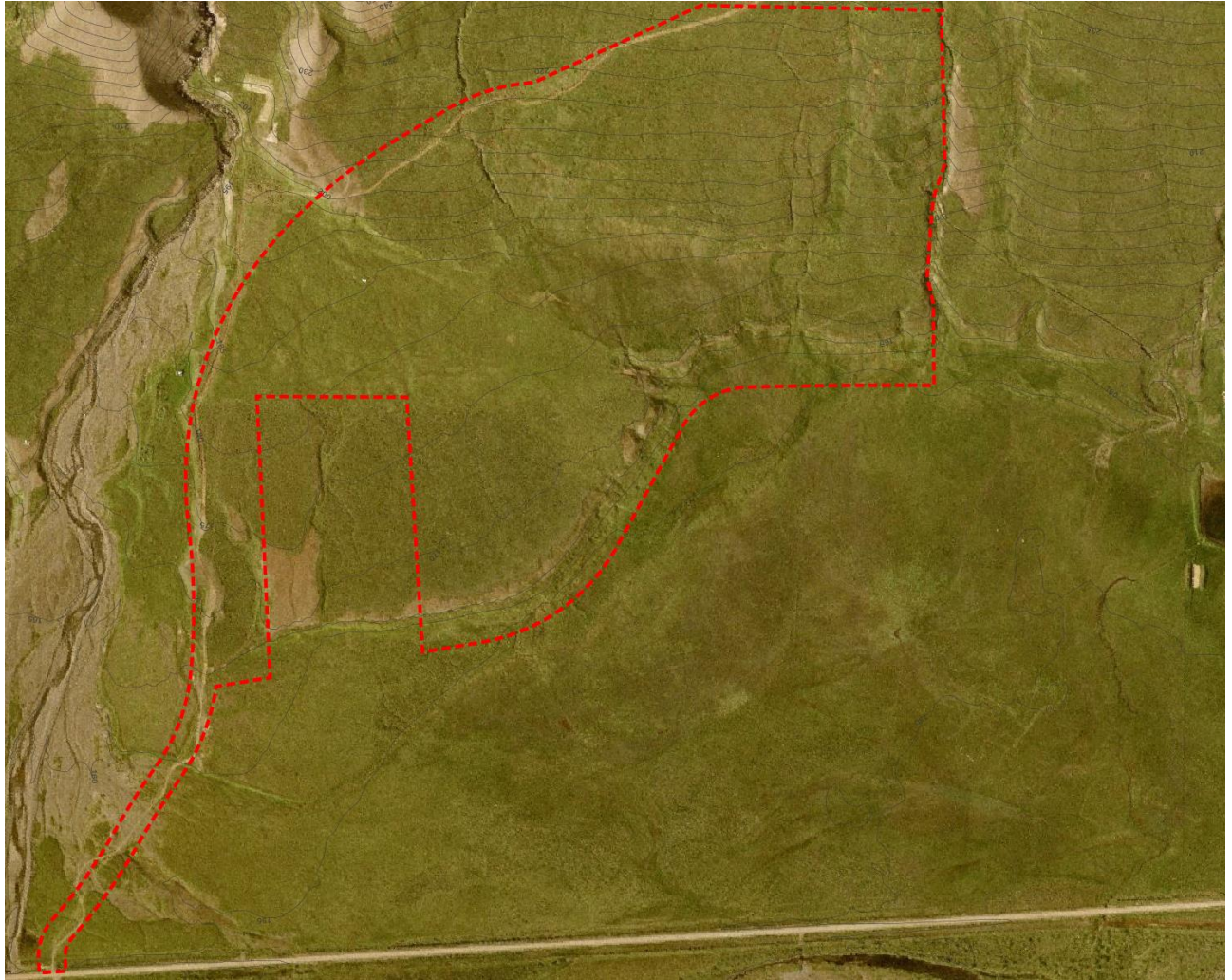
Mynd 2. Afmörkun skipulagssvæðisins fyrri áfanga deiliskipulagsins.