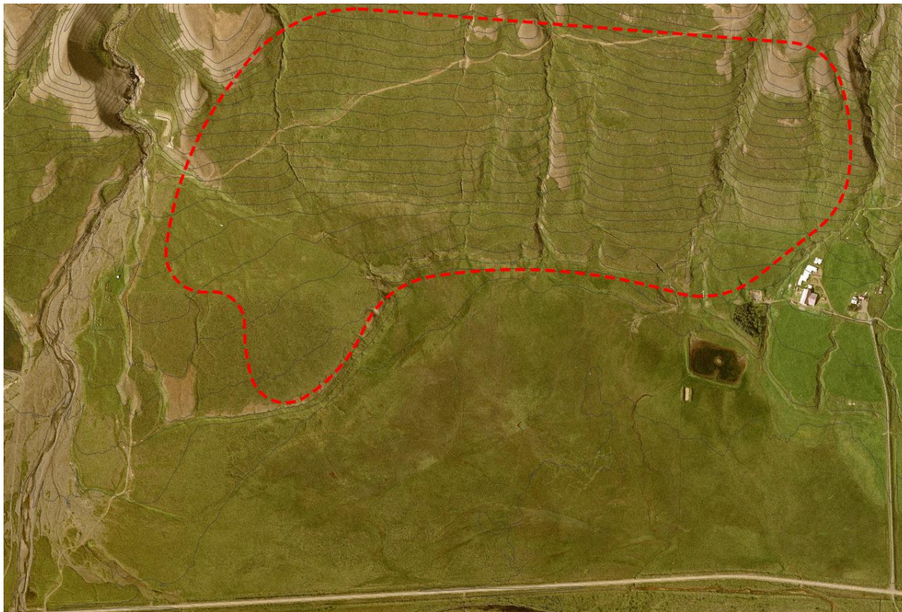
Mynd 1. Afmörkun skipulagssvæðisins eins og gert var ráð fyrir að hún yrði skv. skipulagslýsingu.

Hlíðin innan skipulagssvæðisins er með aflíðandi halla frá vestri niður til austurs og er hæðarmunur innan svæðisins um 80 m (170-250 m.y.s). Gróðurfar í hlíðinni einkennist af mólendi en í gegnum skipulagssvæðið liggur vegslóði frá Grjótá í suðri og upp hlíðina til norðvesturs.